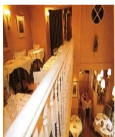
L'Aiguière Paris (11 ème )