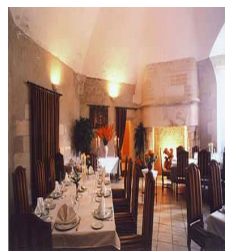
L'Orangerie du Château * Blois (41)