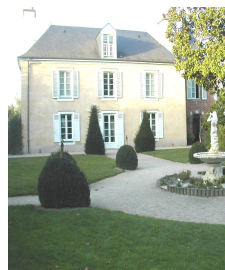
La Fontaine aux Perles * Rennes (35)

Siège social : 132 avenue de villiers 75017 Paris / Tél. : 0820 20 19 20 Fax : 01 45 72 22 15/ www.idealgourmet.fr Sarl au capital de 15000 € - RCS Paris B 451 809 453 00017 - NAF 526B - NII FR 354 518 094 53